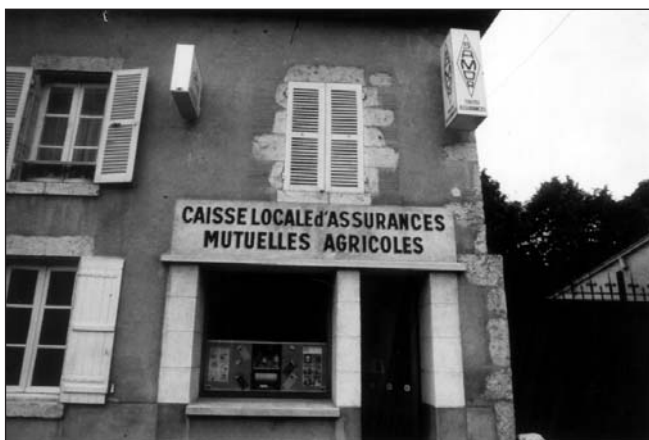
Les premières Caisses locales utilisaient de modestes locaux.

Grâce à sa proximité géographique (jusqu'à 11 000 agences) et psychologique (les Caisses régionales recrutent des gens de la région), jointe à son esprit de service et au